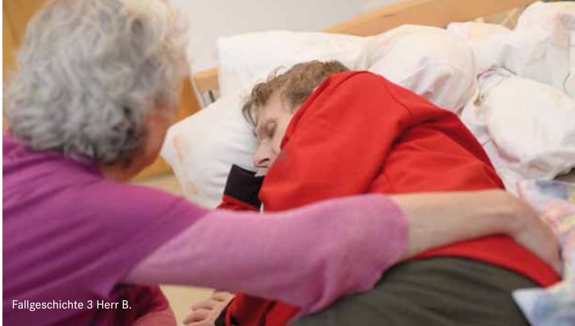
Fallgeschichte 3 Herr B.

Craniosacrale Therapie ist ein Therapiekonzept mit Berührungen des Körpers in der Grundhaltung von Achtsamkeit, Offenheit und Kontakt; Fachausbildung, Methoden, Übung und Erfahrung qualifizieren den Therapeuten. Für den Therapieprozess gestaltet der Therapeut das Setting durch verlässliche, vertrauensvolle Beziehungsgestaltung und Setzen der räumlichen, zeitlichen und finanziellen Bedingungen. Gemeinsam mit dem Patienten klärt er Anliegen, Auftrag und Zielvorstellungen. Die therapeutische Beziehung bietet den sicheren Raum für das Sich-Einlassen auf die heilsame Berührung, so wie auch in verschiedenen Formen der Psychotherapie und der Körperpsychotherapie.