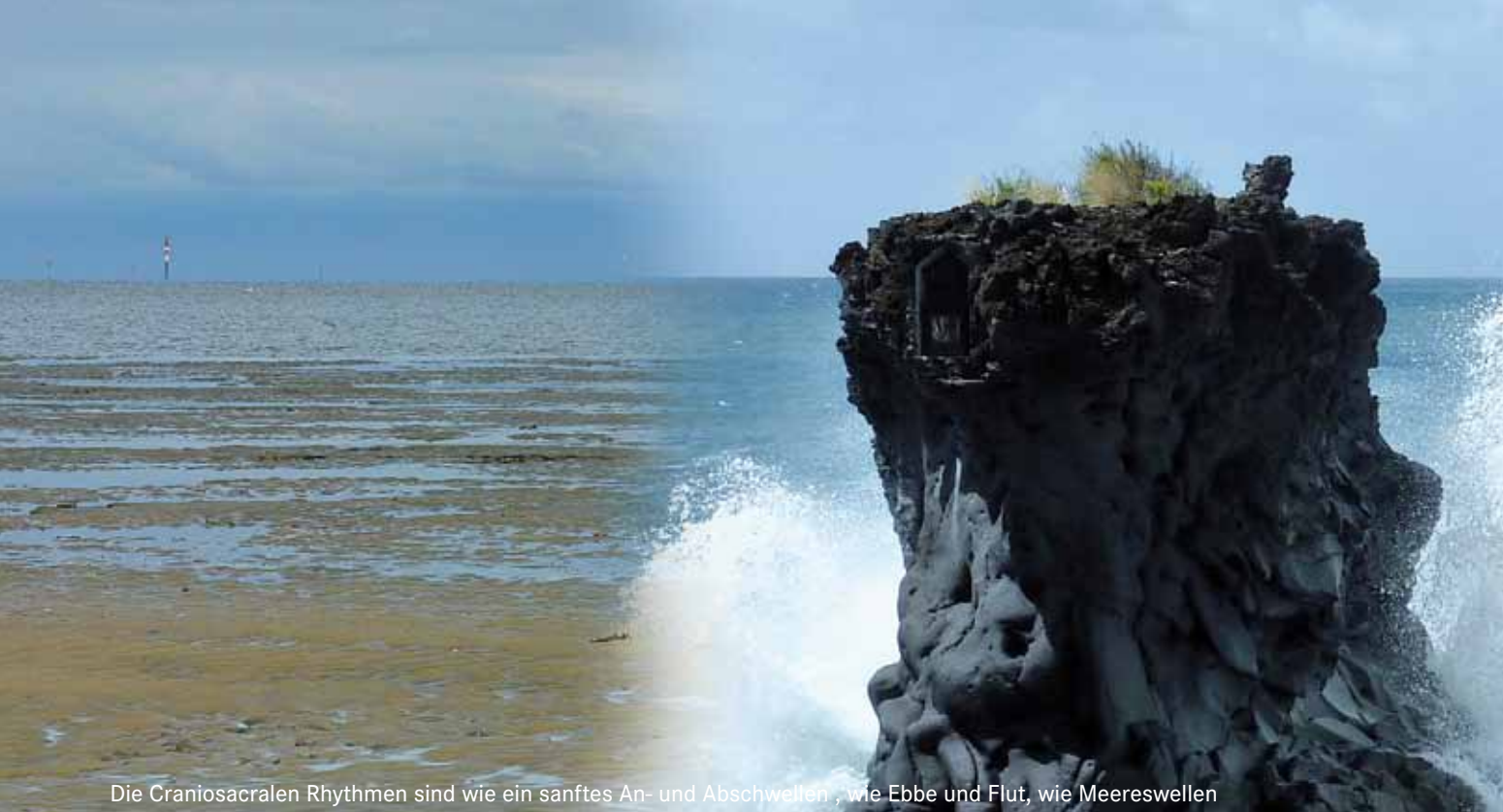
Die Craniosacralen Rhythmen sind wie ein sanftes An- und Abschwellen, wie Ebbe und Flut, wie Meereswellen

Die Craniosacralen Rhythmen sind wie ein sanftes An- und Abschwellen an vielen Stellen des Körpers zu tasten, wie Ebbe und Flut, wie Meereswellen.